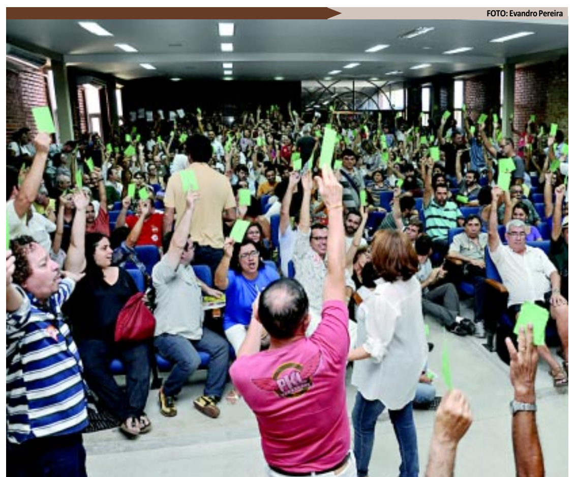
No campus da UFPB em João Pessoa, os docentes decidiram em assembleia pela greve por tempo indeterminado

A segunda reunião aconteceu no dia 13 de abril e teve como foco a possibilidade de unificação das carreiras do Magistério Superior (MS) e do Ensino Básico, Técnico e Tecnológico (EBTT), como defende o Andes. No dia 19 de abril, em novo encontro, nada ficou definido, a não ser uma assembleia geral para o dia 15 de maio, com indicativo de greve.