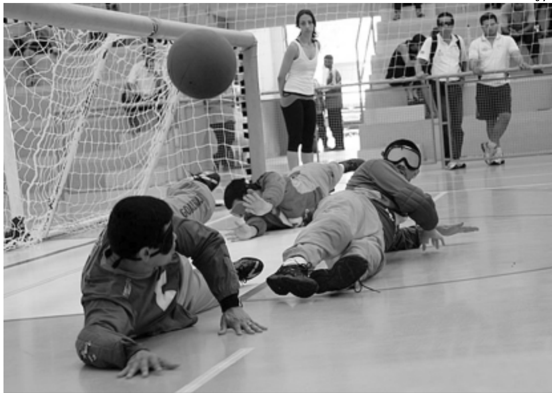
O goalball foi criado em 1946, após a Segunda Guerra Mundial, e é praticado por atletas cegos ou com pouca visão

De acordo com a CBDV, para se inscreverem, as entidades devem enviar a ficha de ins-