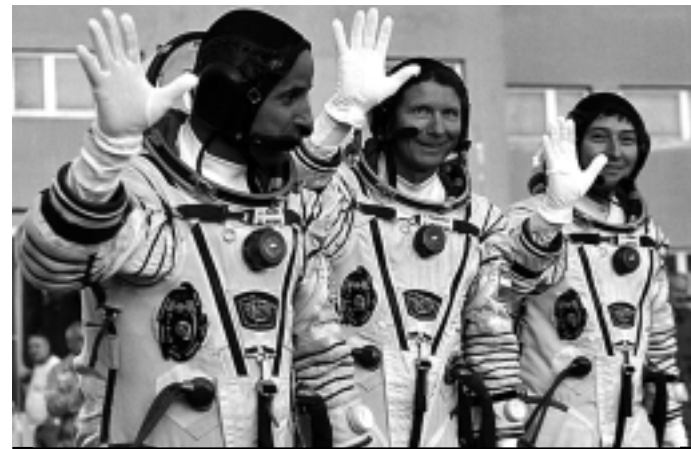
A nave partiu com dois astronautas russos e um outro da Nasa

De acordo com o programa de voo, nesta quinta-feira a Soyuz se acoplará à ISS, atualmente tripulada pelo russo Oleg Kononenko,