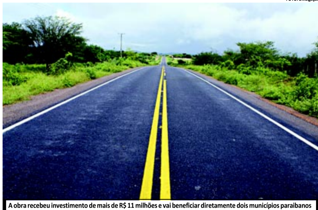
A obra recebeu investimento de mais de R$ 11 milhões e vai beneficiar diretamente dois municípios paraibanos

Com acesso à água para produção, as famílias se fixam no campo, com oportunidades de plantar e criar animais tanto para consumo, melhorando assim sua alimentação, quanto para comercialização, gerando renda extra.