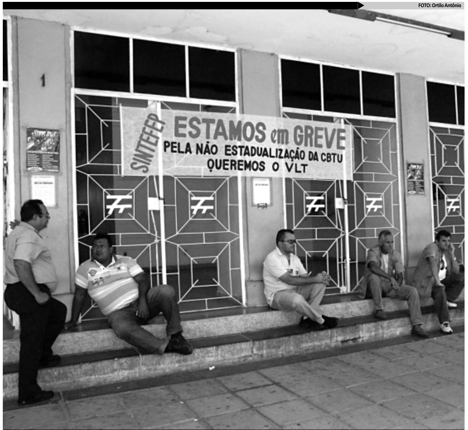
Faixas foram distribuídas no terminal ferroviário nas quais os trabalhadores reivindicam 5,5% de aumento e mais 10% de reajuste nos salários