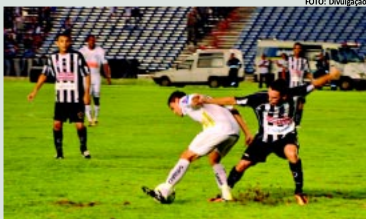
Botafogo e Treze, fundadores da Copa Nordeste, estão fora em 2013

Em março deste ano, a CBF divulgou uma diretriz, de comum acordo com as federações, que somente participarão da disputa as melhores equipes classificadas em seus estaduais, tendo como referência o ano de 2012. Com isso, todos os regulamentos dos estaduais foram feitos nessa perspectiva, com exceção de Pernambuco. A exemplo da última competição organizada pela Liga, a Copa do Nordeste terá dezesseis times. Os estados da Bahia e de