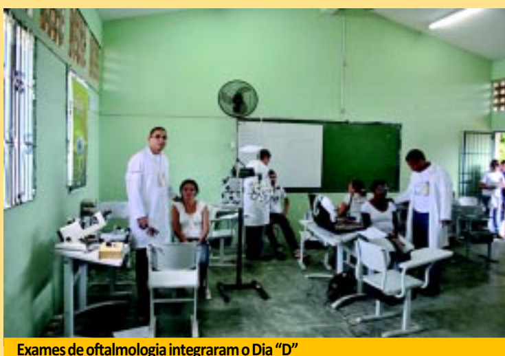
Exames de oftalmologia integraram o Dia "D"