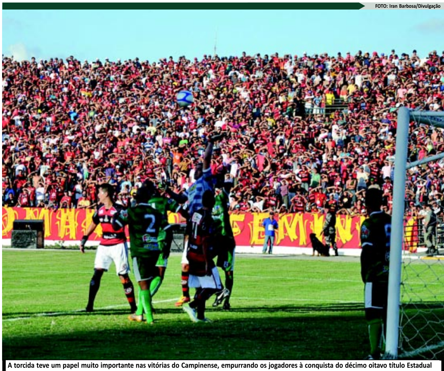
A torcida teve um papel muito importante nas vitórias do Campinense, empurrando os jogadores à conquista do décimo oitavo título Estadual

Encabeçado pelo camisa 9, o elenco rubro-negro iniciou a preparação no dia 13 de dezembro. Até março, quando se encerrou o prazo de inscrições de novos atletas na Paraíba 2012, cerca de 30 jogadores foram contratados. A média mensal da folha de pagamento, conforme William Simões, girou em torno de R$ 180 mil, proporcionando um total de R$ 1 milhão e 80 mil