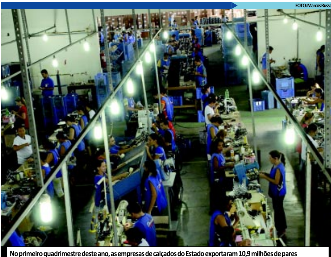
No primeiro quadrimestre deste ano, as empresas de calçados do Estado exportaram 10,9 milhões de pares

O Gira Calçados será sediado em Campina Grande e constará do Seminário Nacional da Indústria de Calçados, que abordará temas como sustentabilidade nas empresas, design e diretrizes que os empresários devem ter para garantir saúde e segurança do trabalhador; salário de inovação, que apresentará as principais novidades em maquinário para unidades fabris e rodadas de negócios. Evento é organizado pela Associação Brasileira das Indústrias de Máquinas e Equipamentos para os Setores do Couro, Calçados e Afins (Abrameq).