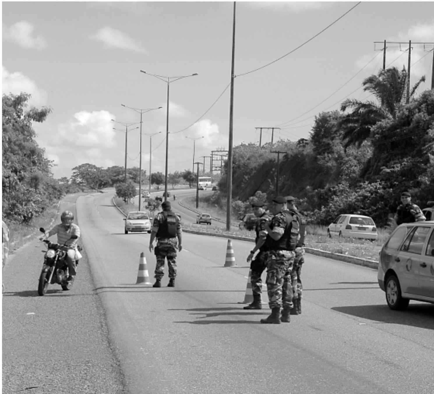
Polícia do Batalhão de Trânsito já contabilizaram 6.907 notificações de condutores somente este ano, quase a metade por dirigir sem habilitação

Enquanto isso, nas ruas, a polícia continua fechando o cerco aos condutores e veículos ilegais que estejam circulando. Somente no último final de semana, 147 veículos foram apreendidos. O balanço parcial de 2012 já chega a 8.193 apreensões de carros e motos. "Esse é um número recorde atingido pelo BPTran em sua história", afirma o comandante Paulo Sérgio.