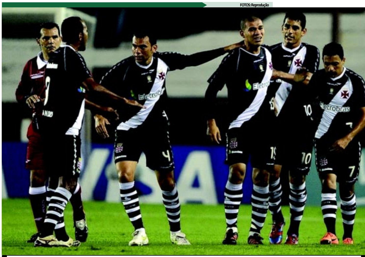
Cruzmaltninos acreditam em jogo difícil e que os pequenos detalhes poderão fazer a diferença nos 90 minutos iniciais da decisão por uma vaga

Há duas semanas, a diretoria do Emelec não permitiu que o Timão realizasse um treino de reconhecimento no estádio George Campwell, em Guayaquil. Na ocasião, os