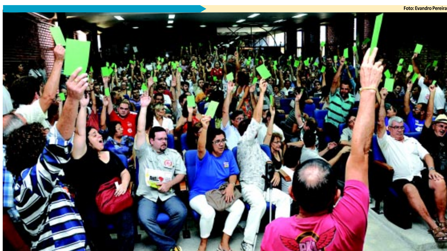
Os professores da UFPB decidiram pela greve durante assembleia realizada ontem pela manhã no Campus I, em João Pessoa

ção vai administrar a UEPB até o ano de 2016 e gerir um orçamento que este ano vai ultrapassar os R$ 283 milhões. A votação acontece das 8 às 22h. PÁGINA 3