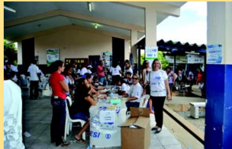
O atendimento ao público foi realizado durante o evento