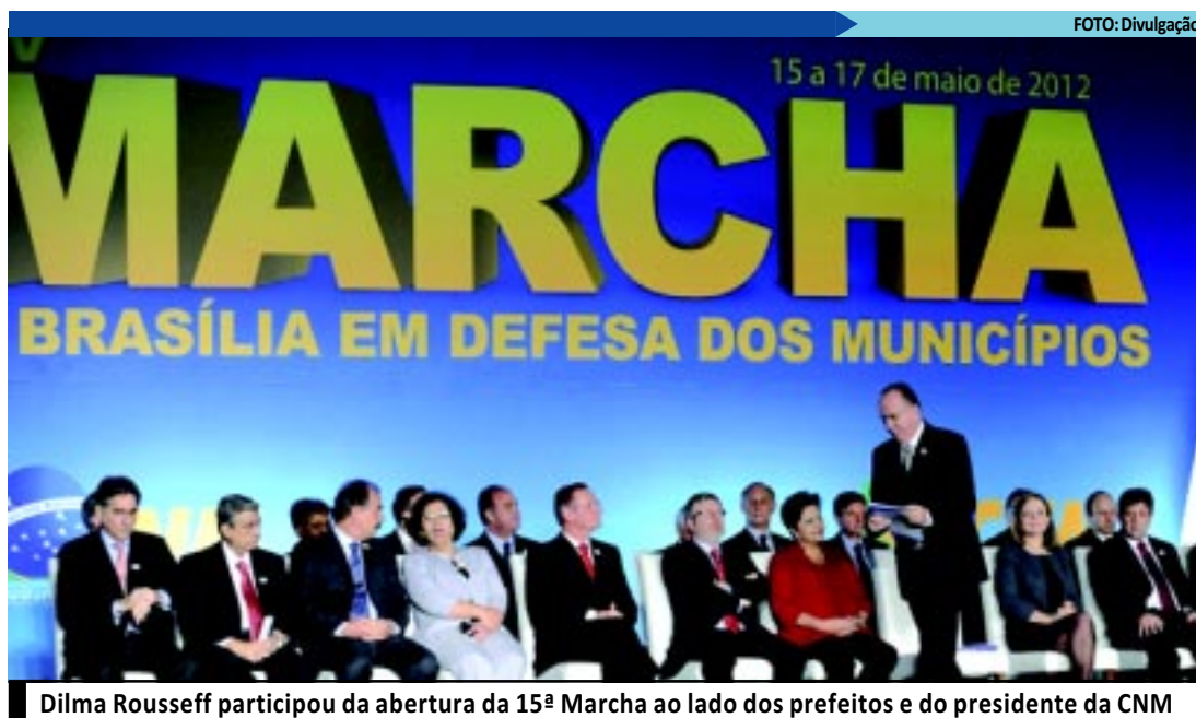
Dilma Rousseff participou da abertura da 15ª Marcha ao lado dos prefeitos e do presidente da CNM