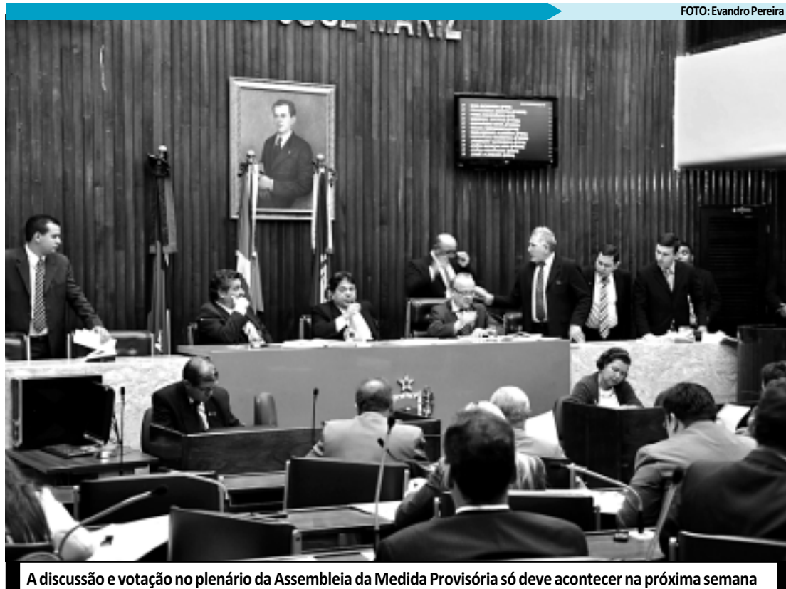
A discussão e votação no plenário da Assembleia da Medida Provisória só deve acontecer na próxima semana

O presidente da comissão eleitoral explica também que após a divulgação do resultado da consulta prévia, um documento constando o resultado será encaminhado para o Conselho Universitário, responsável por homologar o pleito e encaminhar para o Governador do Estado, que deverá realizar a nomeação dos candidatos da chapa vencedora. O próximo reitor (a) e vice-reitor (a) irão assumir o cargo em janeiro de 2013, e deverão comandar a universidade até o final de 2016.